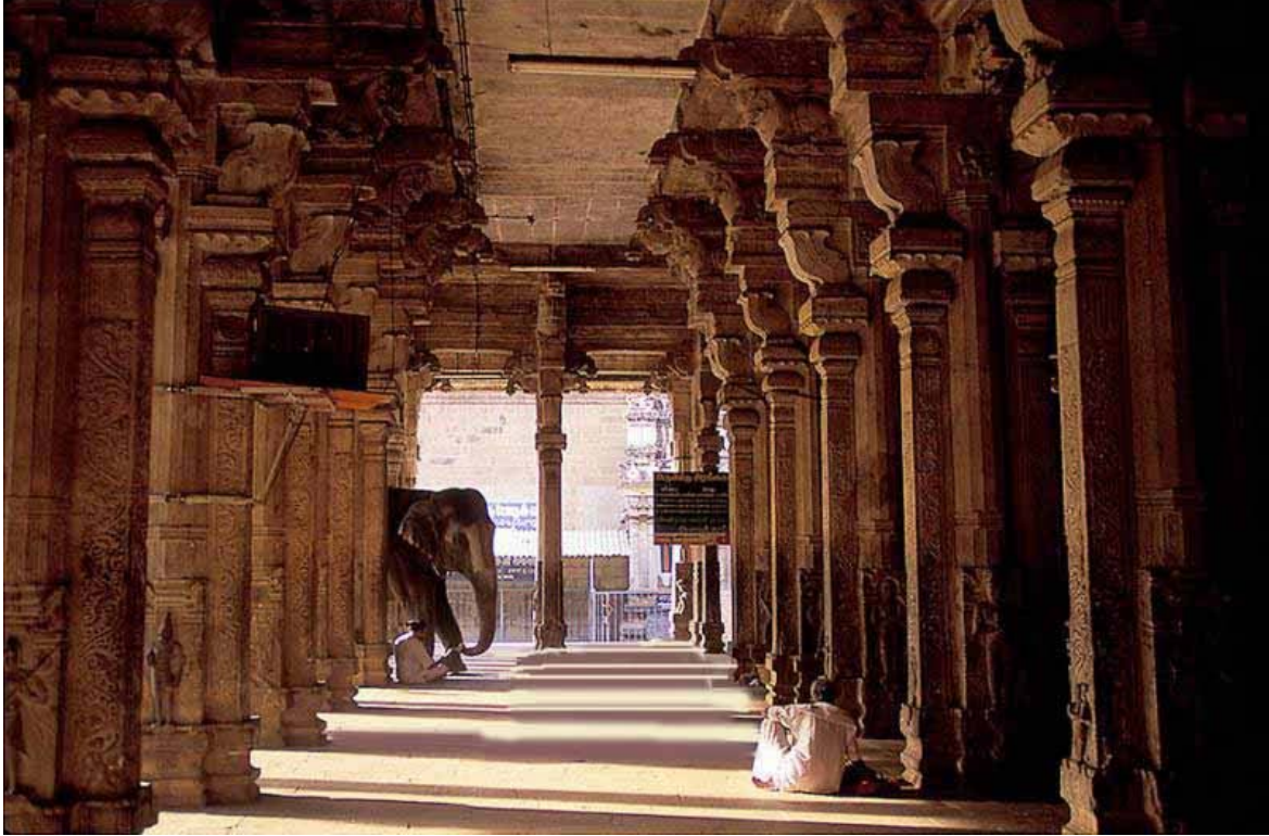
'1000 Pillar Mandapam- Srirangam'