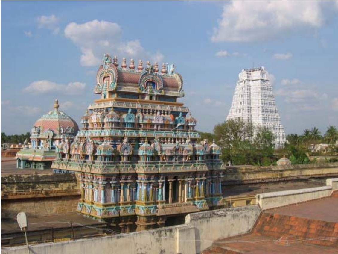
"neel mathil arangan"

amalan AthipirAn adiyArkku ennai Atpaduththa- vimalan viNNavar kOn viraiyAr pozil vEngkadavan nimalan ninmalan nIthi vAnavan, nILmathil arangaththu ammAn, thiruk kamala pAtham vanthu enkaNNinuLLana okkinRathE.