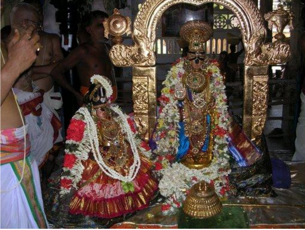
நம்பெருமாள் உறையூரில் கமலவல்லி நாச்சியாருடன் ஸேவை சாதிக்கிறபடி

உறவுமுறை மாறாமல் இருக்கும் பரமபதத்தின் நாயகன் - இப்படிப்பட்டவன் யார் என்றால் - உயர்ந்த திருமதிங்கள் சூழ்ந்த திருவரங்கத்தின் பெரியகோயிலில் கண்வளரும் அழகியமணவாளன் ஆவான். அவனது திருவடித்தாமரைகள் எனது கண்களில் தானாகவே வந்து புகுந்தன.