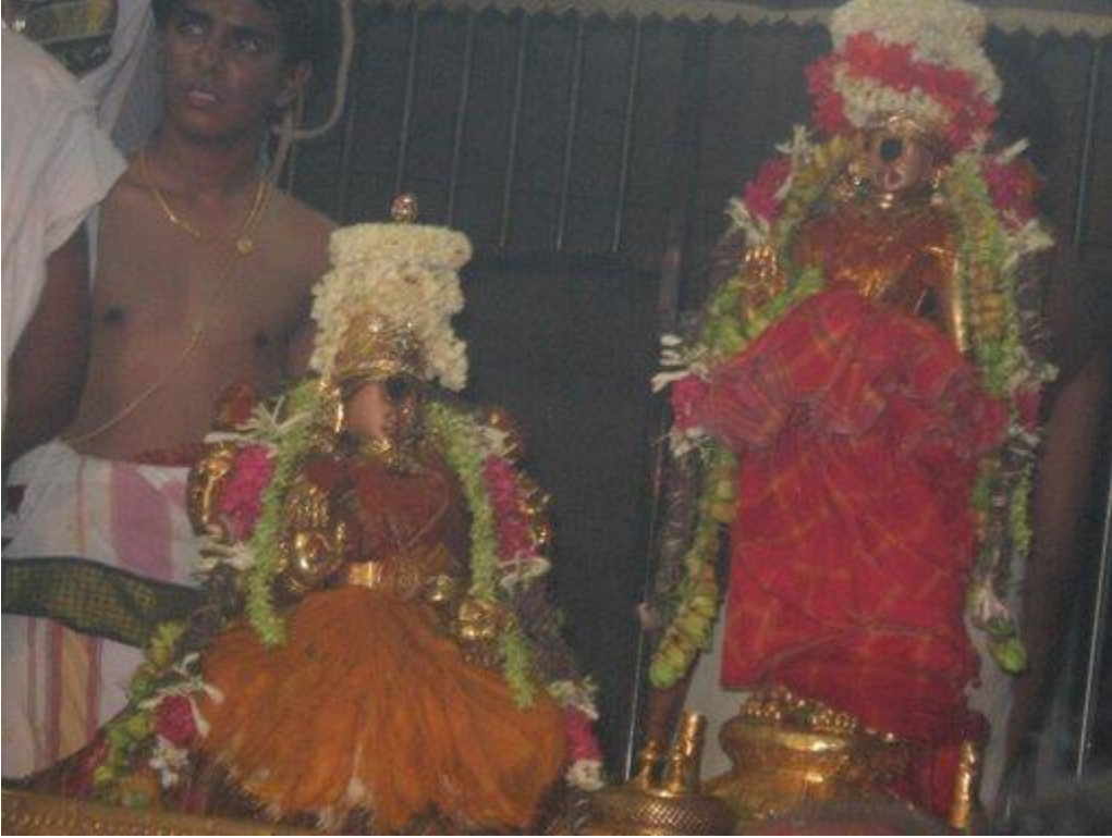
ஆழ்வாரை ஆட்கொண்ட நம்பெருமானின் திருமார்பு

பொருள் - எனது பழவினை காரணமாக உண்டான பாவங்கள் எனக்குப் பெரும் சமையாக நின்றன. அந்தப் பாவங்களின் தொடர்பை நம்பெருமாள் முற்றிலுமாக அறுத்தான். அதன் பின்னர் என்னை அவனிடம் மிகவும் அன்புடன் இருக்கும்படிச் செய்தான். இவ்விதம் செய்ததுடன் நிற்கவில்லை. எனது நெஞ்சத்தில் முழுமையாக ளுழைந்து அங்கேயே நிலை கொண்டுவிட்டான். இவ்விதம் அவன் எனக்குச் செய்த நன்மைகளுக்காக நான் என்ன தவம் செய்தேன் என்று அறியவில்லை. ஸ்ரீரங்கநாச்சியார் என்னும் ஆபரணத்தையும் கொண்ட அவனது அழகான திருமார்பு அல்லவோ என்னை அவனிடம் அடிமைப்படுத்தியது?