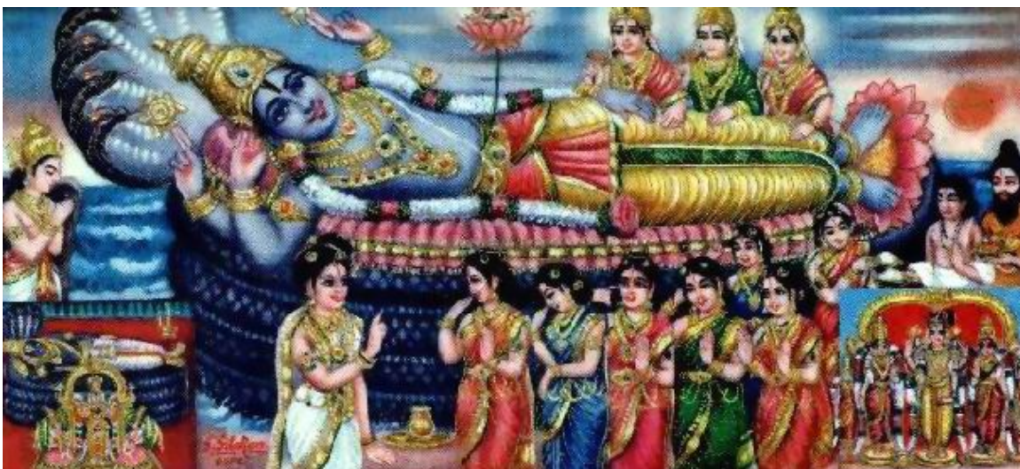
Amalan - AthipirAn