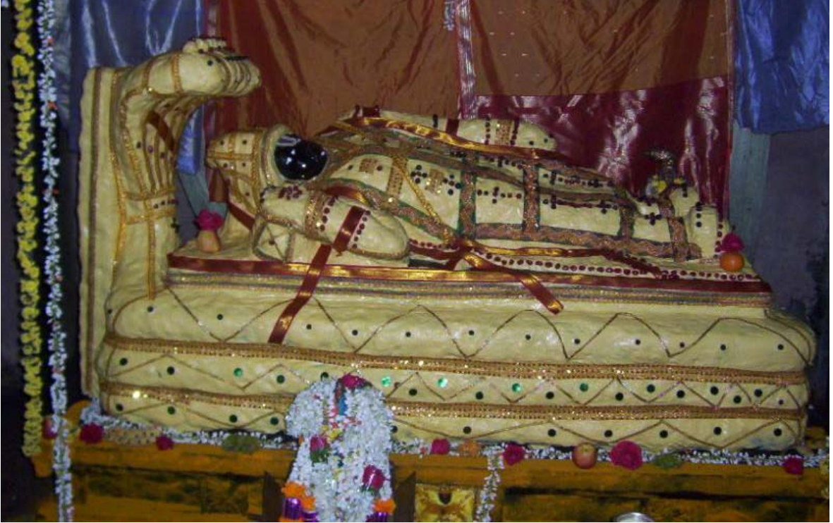
'Ranganatha in veNNAikkAppu'

pariyanAki vantha avuNan udalkINda, amararkku- ariya AthipirAn arangaththu amalan mugaththu, kariyavAkip pudaiparanthu miLirnthu sevvariYodi, nINdavap-periya vAya kaNkaL ennaip pEthamai seythanavE!