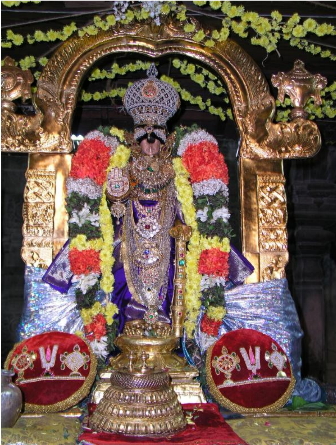
Lord of Srirangam'