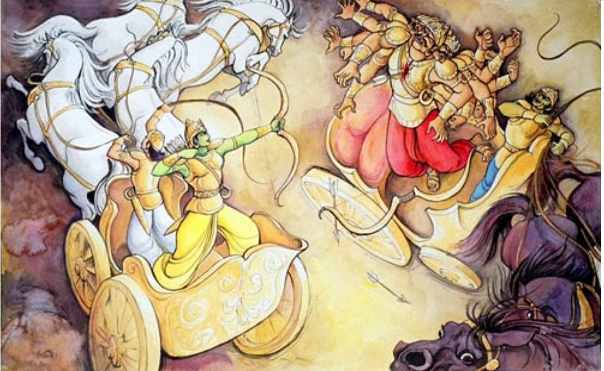
'His piercing arrows destroyed the demons' Artwork courtesy of Madhavapriya www.glimpseofkrishna.com

Uvantha uLLaththanAy ulagam aLanthu aNdamuRa, Nivantha nILmudiyAn anRu nErnthA nisAsararai, Kavarnta vengkaNaik kAkuththan kadiyArpozil arangaththammAn, Ariachchivantha Adaiyin mEl senRathAm en sinthanaiyE.