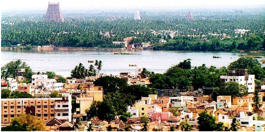
'Holy Srirangam Surrounded by Groves'

thuNda veNpiRaiyan thuyar thIrththavan anjiRaiya- vaNduvAz pozilsUz aranganagar mEya appan aNdar aNda pagiraNdathtu oru mAnilam ezumAlvarai, muRRum-uNda kaNdam kaNdIr adiyEnai uyyakkoNdathE.