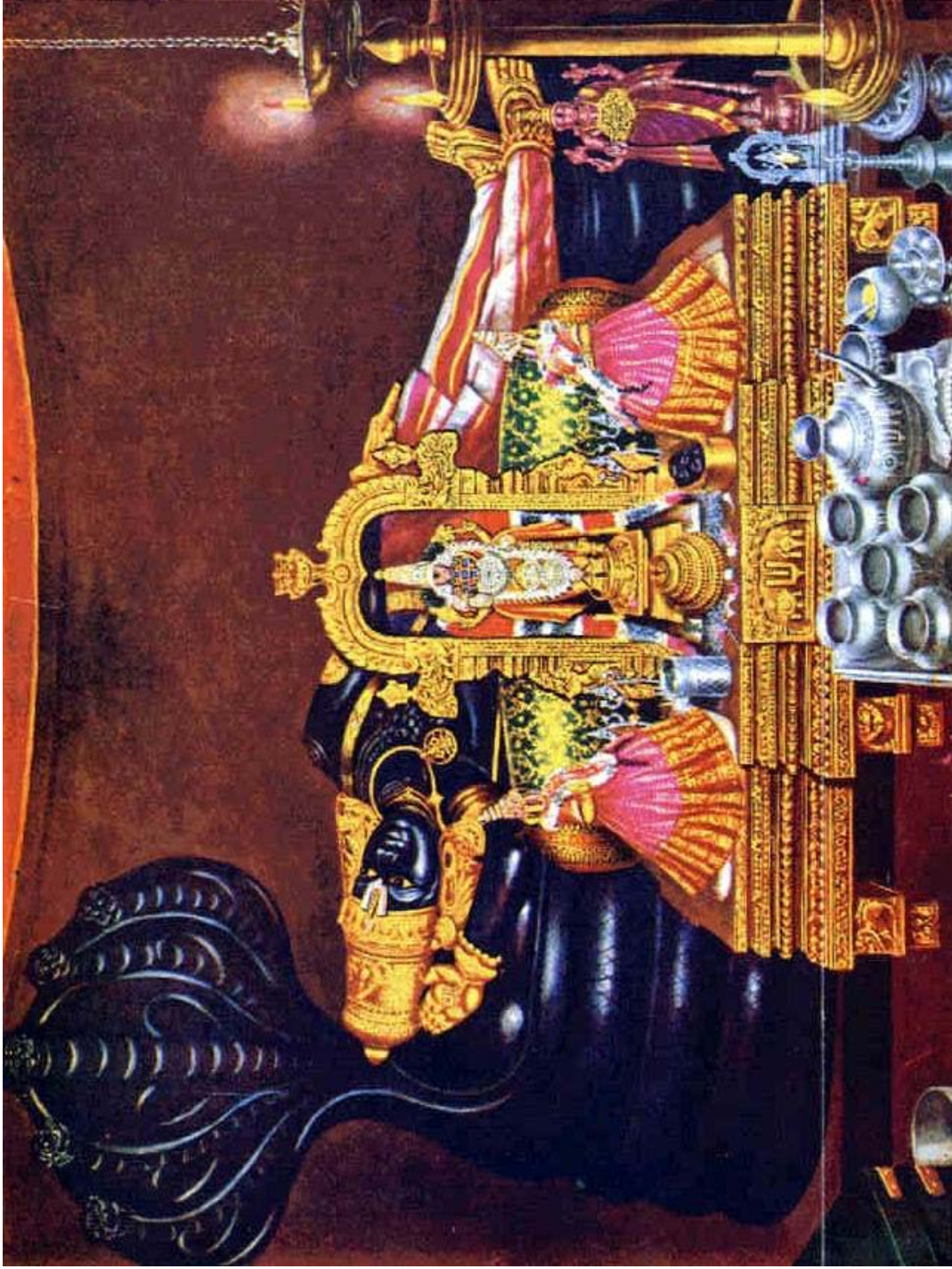
'Whole Divine Archa Form'