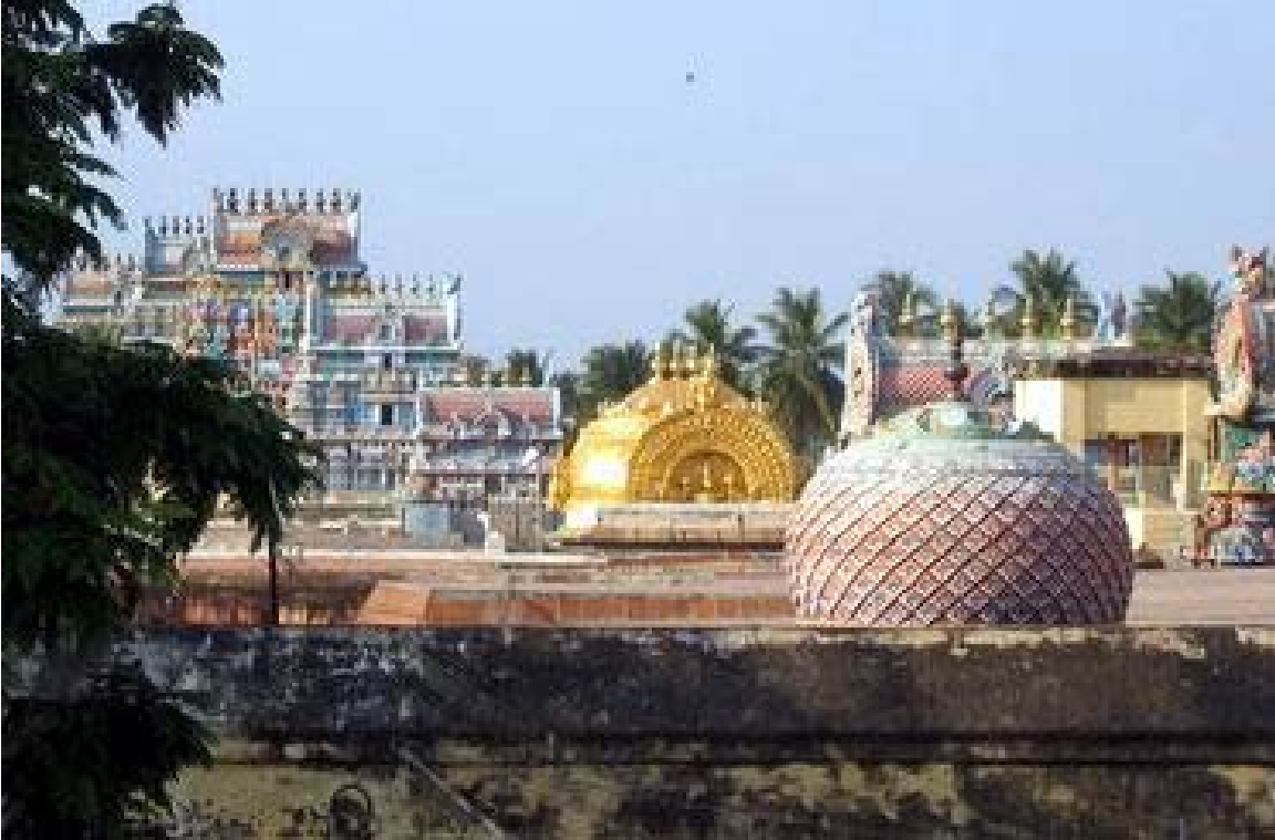
'Gopuram- Vimanam of Srirangam'