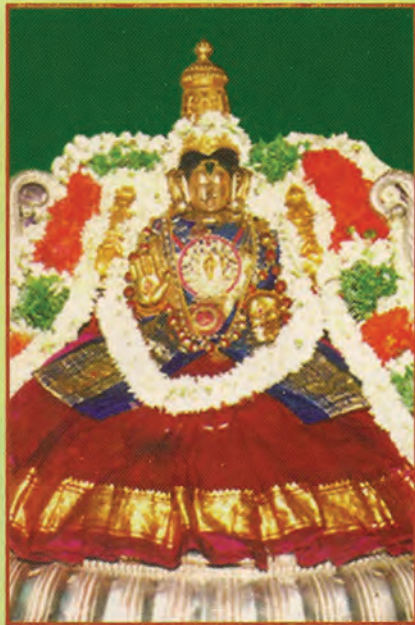
ஸ்ரீ அம்ருதவல்லித்தாயார் - அஹோபிலம் ஸ்ரீ செங்கமலவல்லித்தாயார் - மன்னார்குடி