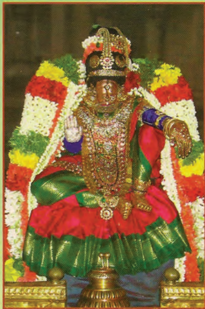
ஸ்ரீ கனகவல்லித்தாயார் - திருவள்ளூர் ஸ்ரீ வேதவல்லித்தாயார் - திருவல்லிக்கேணி